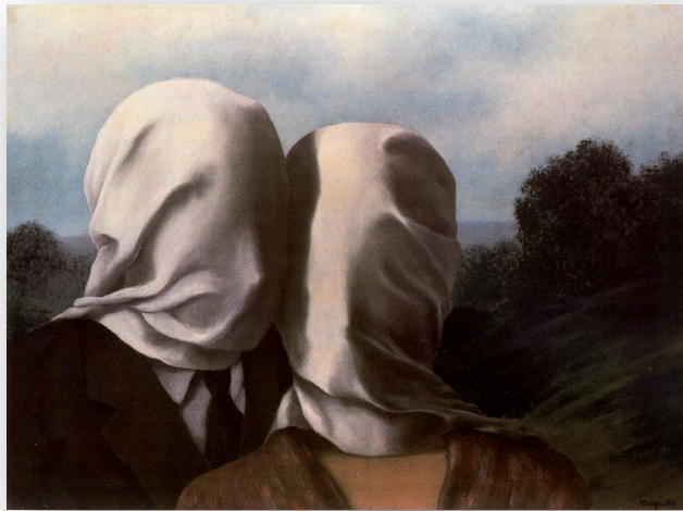
Les amants, René François Ghislain Magritte

Pourrais-tu reconnaître qui sont ces personnes ? Pourquoi ?