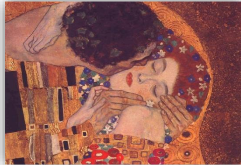
Détail de la peinture « Le Baiser » de Gustav Klimt.

« Homme et femme, il les créa » (Gn 1,27)