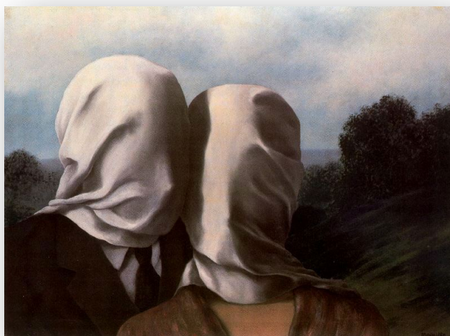
Gli amanti, René François Ghislain Magritte

Potresti identificare di quali personaggi si tratta? Perché?