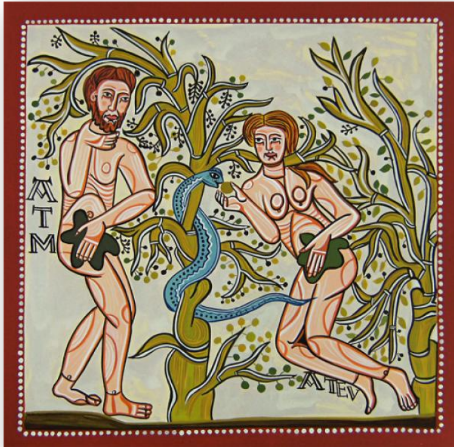
Frammento di pittura murale, eremo della Vera Cruz de Maderuelo (Segovia), secolo XII. Attualmente al Museo del Prado (Madrid).